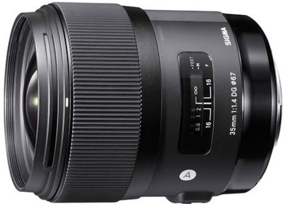
بهترین انتخاب: Sigma 35mm F1.4 DG HSM Art

لنز 35mm F1.4 Art از کمپانی سیگما با ارایه یک فاصله کانونی مناسب کیفیت تصویر نسبتاً خوب به همراه قیمت مناسب را ارایه می دهد .