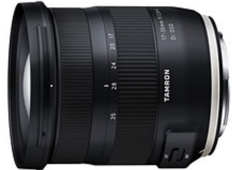
بهترین انتخاب از لحاظ قیمت: Tamron 17-35mm F2.8-4 Di OSD

لنز 16-35mm F4 IS از کمپانی کانن در دامنه های ثابت انگل از یک کیفیت تصویر بسیار مطلوب برخوردار است . علاوه بر این ؛ استابیلایزر پر قدرت موجود در درون این لنز امکان تهیه تصاویر با کیفیت در شرایط نسبتا کم نور را به وجود می آورد .