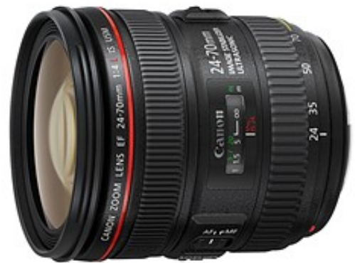
بهترین انتخاب از لحاظ قیمت: Canon EF 24-70mm F4L IS USM

اگر چه کیفیت تصویر این لنز با لنز های پرایم سری آرت سیگما قابل مقایسه نیست اما با این حال یک گزینه خوب و مقرون به صرفه در مقایسه با مدل مشابه ساخت کانون به شمار می آید .