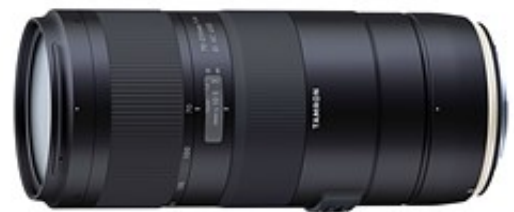
بهترین انتخاب از لحاظ قیمت: Tamron 70-210mm F4 Di VC USD

این لنز از فوکوس سریع برای عکاسی از سوژه‌های دارای حرکت برخوردار است و از انعطاف پذیری نسبتاً بالا در دامنه‌های تله فتو برخوردار است .