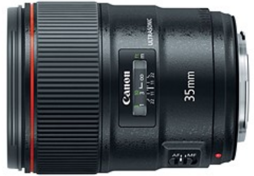
بهترین انتخاب از لحاظ کیفیت: Canon EF 35mm F1.4L II USM

در انتخاب یک لنز 35 میلیمتری ، بدون تردید لنز Canon EF 35mm F1.4L II USM یکی از بهترین انتخاب هاست که کیفیت تصویر بسیار مطلوب را به دست می آورد .