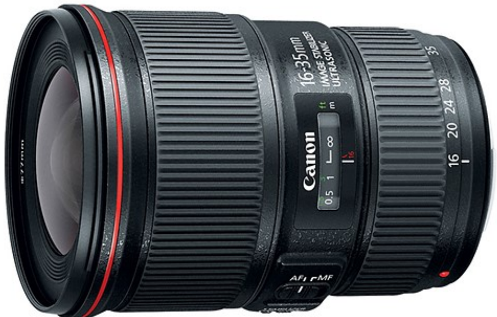
بهترین انتخاب: Canon EF 16-35mm F4L IS USM

لنز های وایدانگل به طور معمول برای استفاده در سبک های عکاسی طبیعت و منظره و معماری و فضاهای داخلی مناسب هستند .