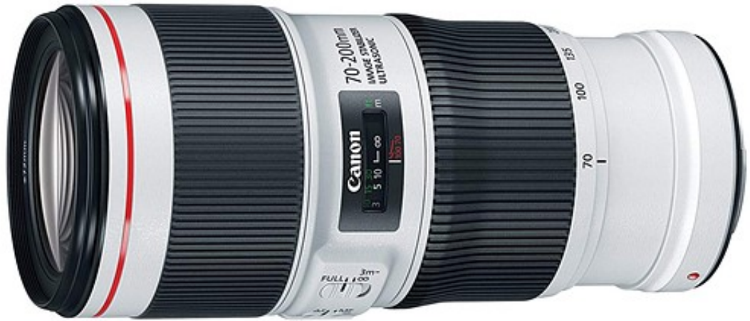
بهترین انتخاب: Canon EF 70-200mm F4L IS II USM

لنز 70-200mm F4 L از لحاظ قیمت و کیفیت تصویر یک گزینه کاملاً ایده آل است .