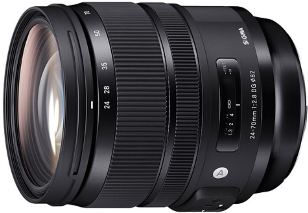
بهترین انتخاب: Sigma 24-70mm F2.8 DG OS HSM Art

و در بسیاری از موارد برای عکاسی در سبک های پرتره مورد استفاده قرار می گیرند .