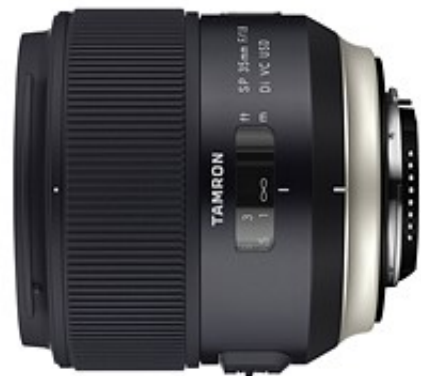
بهترین انتخاب از لحاظ قیمت: Tamron SP 35mm F1.8 Di VC USD

لنز 35mm F1.4 Art از کمپانی سیگما با ارایه یک فاصله کانونی مناسب کیفیت تصویر نسبتاً خوب به همراه قیمت مناسب را ارایه می دهد .