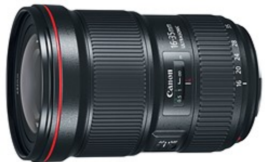
بهترین انتخاب از لحاظ کیفیت: Canon EF 16-35mm F2.8L III USM

لنز تامرون Tamron 17-35mm کیفیت همسان با لنز های ساخت کانن را ارایه نمی دهد و فاقد استابیلایزر است اما برای افرادی که گزینه قیمت را در اولویت قرار می دهند ؛ یک انتخاب مناسب به شمار می آید .